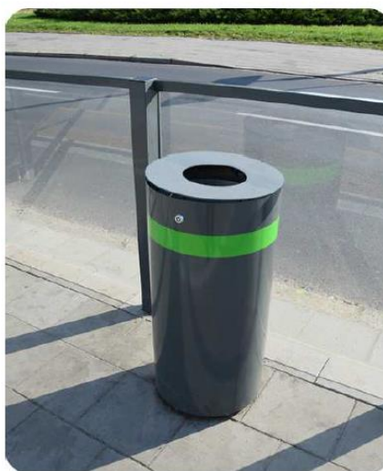
Ryc. 1 Poglądowy rysunek kosza na śmieci